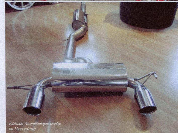
Edelstahl-Auspuffanlagen werden im Haus gefertigt.