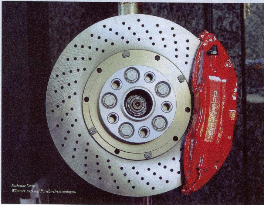
Packende Sache: Wimmer setzt auf Porsche-Bremsanlagen.