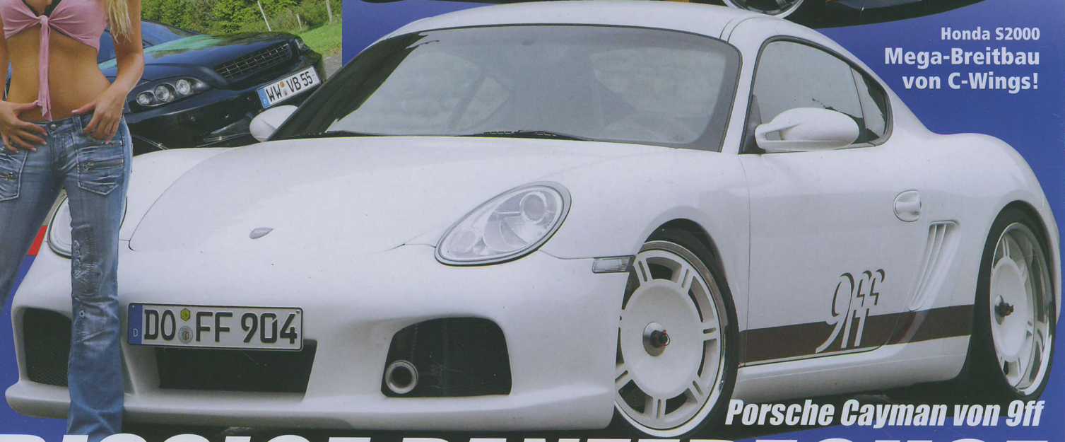
Porsche Cayman von 9ff