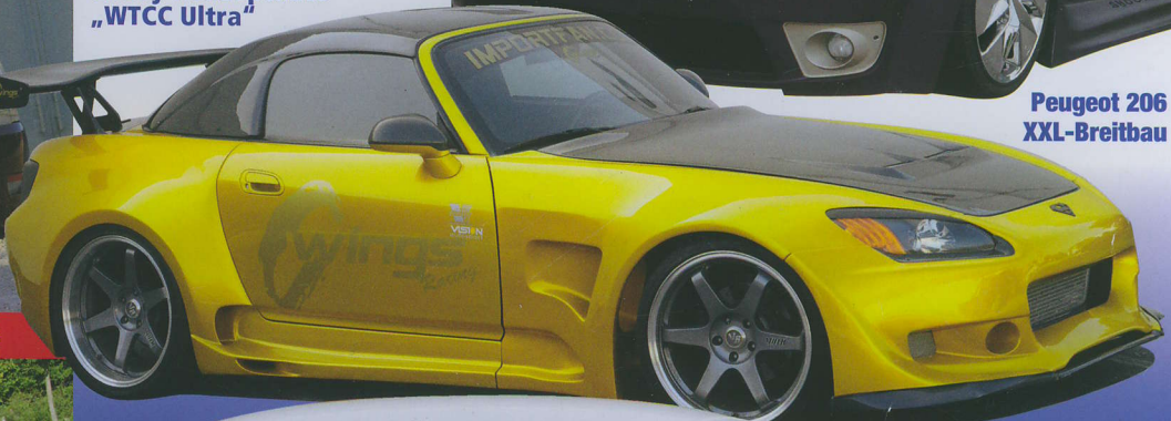
Honda S2000 Mega-Breitbau von C-Wings!