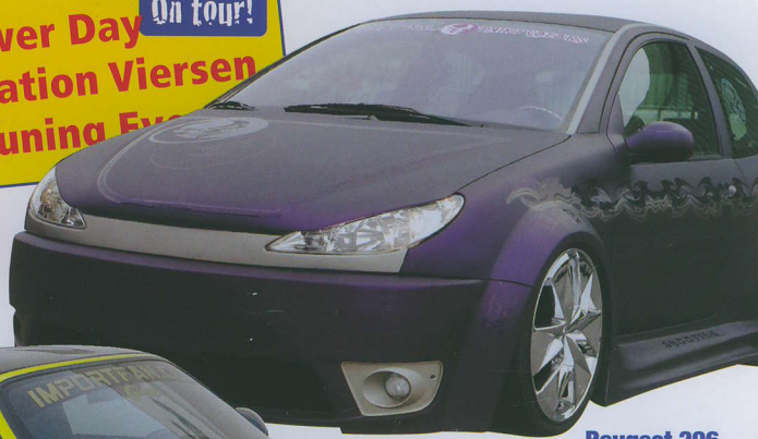
Peugeot 206 XXL-Breitbau